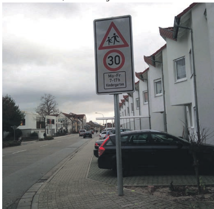
Tempo-30-Schild beim KiGa Grenzhöferstr.