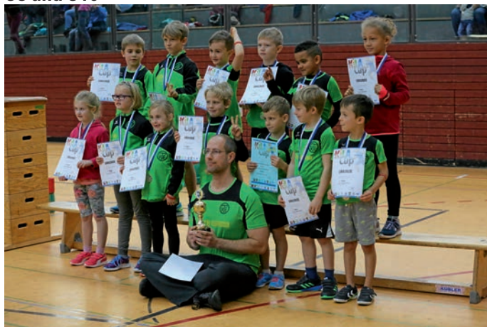
Doppelsieger in Wiesloch: die U8-Mannschaft des TVEText und Bild: TVE

Am vergangenen Sonntag schlossen die jungen Leichtathleten des TVE eine erfolgreiche Saison mit dem letzten Wettkampf in Wiesloch ab. Erneut stellte der TVE mit insgesamt sechs Mannschaften in den Altersklassen U8, U10 und U12 das größte Teilnehmerfeld von allen Vereinen. Die U8 gewannen die Tageswertung und die Cupwertung. Die U10 konnte sich den vierten Platz in der Tageswertung sichern, siegten aber dennoch in der Cupwertung. Die U12 freute sich ebenfalls über einen vierten Platz in der Tageswertung und den fünften in der Cupwertung. In der Saison von Mai bis Dezember hatten die TVE-Jungathleten insgesamt fünf Wettkämpfe absolviert und sich mit Teams von Weinheim bis Eberbach gemessen. Neben den hervorragenden Ergebnissen war die Anzahl unserer Kinder, die an den Wett-