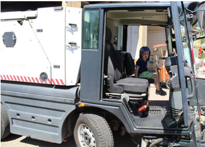
Kleiner Mann, großes Auto: Simeon darf hinterm Steuer eines Autos von Grundstückspflege Müller.