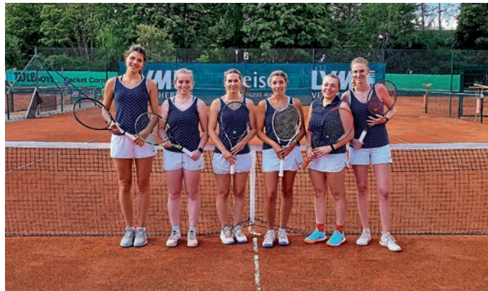
Die Damenmannschaft des ETC.