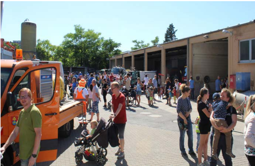
Bei herrlichem Wetter fanden am Freitagnachmittag viele Besucherinnen und Besucher den Weg zum Bauhof-Gelände. Der Kindertag, der auch die Erwachsenen begeisterte, war ein voller Erfolg.