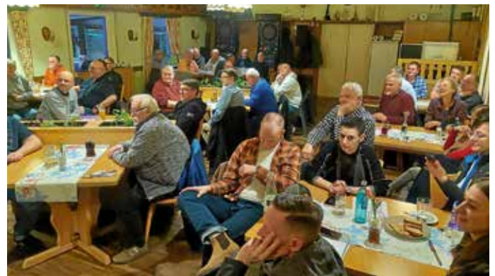
Mitglieder bei der Jahreshauptversammlung 2024