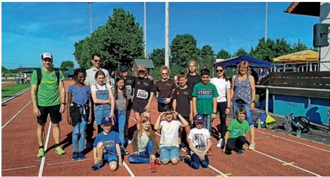
Am Wettkampfwochenende des TVE nahm auch der Nachwuchs des hochwassergeschädigten TuS Ahrweiler statt, den der TVE bei seinem Spendenlauf unterstützt hatte