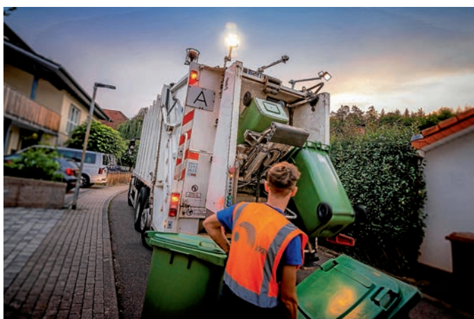
Die AVR Kommunal bietet den Bürgerinnen und Bürgern des Rhein-Neckar-Kreises bereits seit dem 01. Januar 2022 gebührenfrei zusätzliches Behältervolumen der Grünen Tonne plus an.

Die Grüne Tonne plus gibt es in den Größen 120 Liter, 240 Liter, 770 Liter und 1.100 Liter.