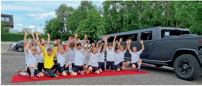
Die D2-Fußballer des ASV/DJK: Meister in der Kreisklasse