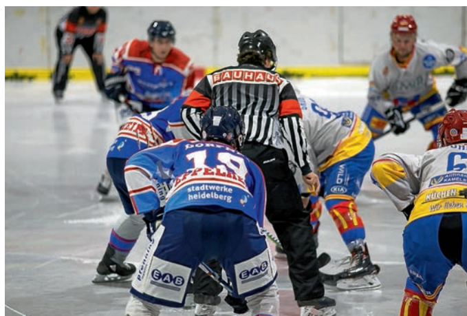
„Auch gegen Freiburg müssen die Eisbären vom Bully an hellwach sein“

Der ECE kann dank des ersten Saisonsieges vor Wochenfrist etwas befreiter aufspielen, wird jedoch alles in die Waagschale werfen müssen, um diesem den nächsten Folgen zu lassen. Mit einem Gegentorschritt von 3,3 liegt der ECE in den Top 3 der Liga, offensiv findet man sich jedoch unter den letzten 3 Teams (2,3 Tore pro Spiel). In beiden Wertungen liegt der EHC Freiburg auf dem letzten Platz, so dass die Eisbären als Favorit ins Rennen gehen. Dabei wird man voraussichtlich erneut nahezu aus dem vollen Schöpfen können, auch Neuzugang Marco Haas steht nach überstandener Schulterverletzung voraussichtlich wieder zur Verfügung