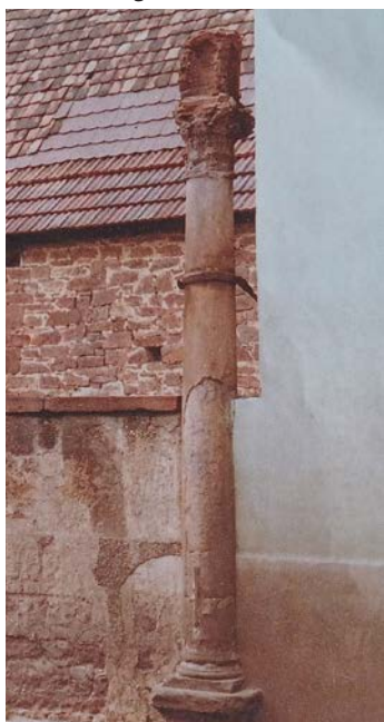
Die Original-Bildstocksäule war Teil eines Bauernhauses in der Schwetzinger Straße vor dessen Abriss, auf dem Bild schon ohne das Lothringer Kreuz.

Neuer Standort an der Grenzhöfer Spitze gibt Anlass zu Diskussionen in der Stadtgesellschaft