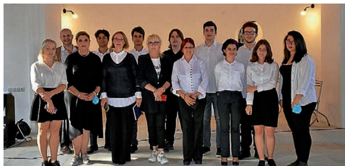
Der evangelische Kirchenchor Tiflis.

Für die 15 Mitglieder des Kirchenchors (10 Frauen und 5 Männer) suchen wir noch vom 19. bis 21. Juli Übernachtungsmöglichkeiten, gerne auch Mehrbettzimmer. Wer uns bei der Suche helfen kann, wende sich bitte an das evangelische Pfarramt, Telefon 06221/76 00 27) oder per E-Mail an: eppelheim@kbz.ekiba.de