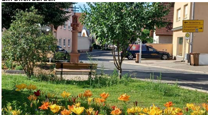
Die Bildstocksäule hat jetzt an der Grenzhöfer Straße einen neuen Standort gefunden.