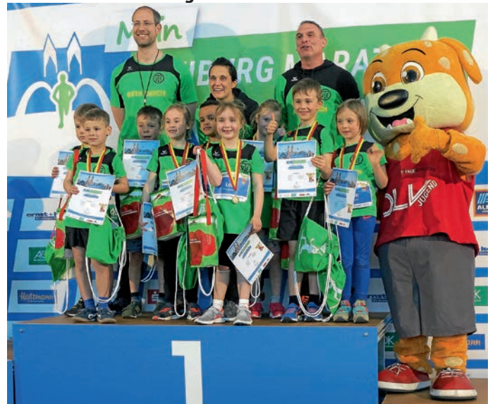
Die erfolgreiche U8 des TVE beim Badenfinale in Freiburg

Die Erfolgsserie der TVE-Jugend reißt nicht ab: Beim Badenfinale am 6. April in Freiburg holten die Mannschaften der U8 und U10 jeweils den Sieg nach Eppelheim, die der U12 einen hervorragenden 3. Platz.