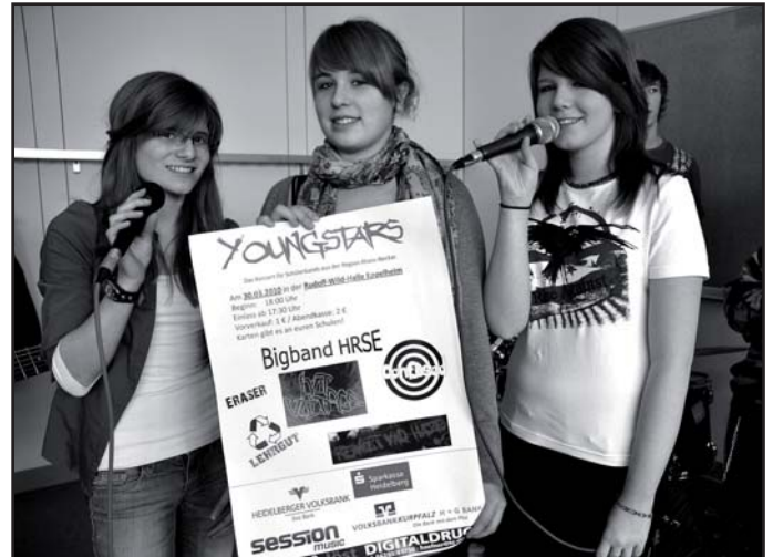
Das Bild zeigt die Sängerinnen der Realschulband „Confused“ mit dem Werbeplakat für das Rockkonzert „Youngstars“.