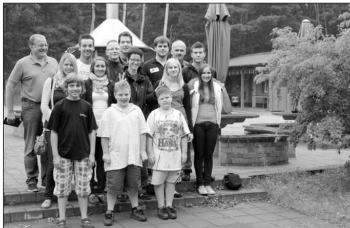
Der KV Eppelheim war in Spremberg zu Gast.