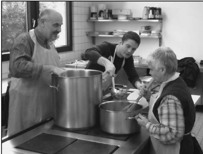
Küchenteam in Aktion

02.01.10 11-13 Uhr, Generalprobe, kath. Gemeindehaus 06.01.10 Aussendung, Besuch Eppel Nord 10.01.10 Besuch Eppel. Süd eppelheimersternsinger@t-online.de, Bernd Hönig Tel. 765130