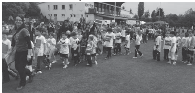
Bei den Klassenstufen 1/2 gewannen die „Englischen Löwen“

Viele Mitglieder der Fußball-Abteilung sorgten für ein abwechslungsreiches Catering. Am Ende der Veranstaltung freuten sich alle Kids über die erzielten Platzierungen und die kleinen Trostpreise, welche die Veranstalter organisiert hatten.