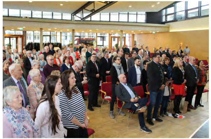
Beim Badnerlied, gespielt vom Spielmannszug der Feuerwehr, sang das Publikum mit.