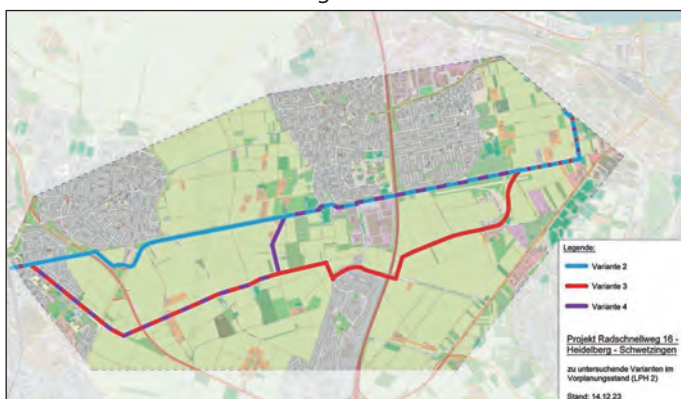
Varianten 2, 3 und 4 im Vorplanungsstadium.

Unter Federführung der Stadt Schwetzingen planen die Städte Heidelberg und Eppelheim sowie die Gemeinde Plankstadt gemeinsam mit dem Regierungspräsidium Karlsruhe den Radschnellweg von Heidelberg nach Schwetzingen. Startpunkt für den Radschnellweg 16 (RS 16) ist die Heidelberger Bahnstadt. Dort schließt die Verbindung an bereits bestehende Radwege an. Der Endpunkt wird in Schwetzingen auf der Ostseite der Bahntrasse der Deutschen Bahn liegen.