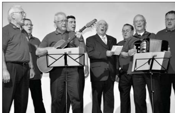
Der Jubilar mit den Besenfreunden