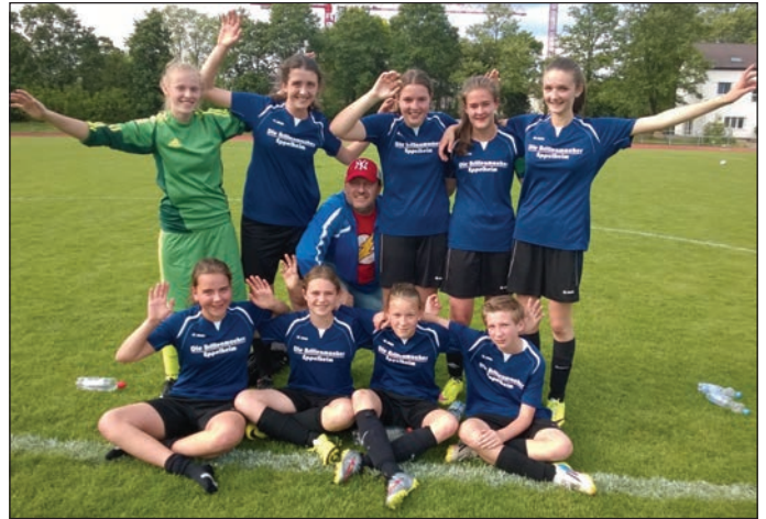
Kader der C-Juniorinnen: