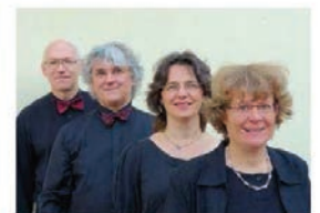
Vokalensemble Paulus vocal