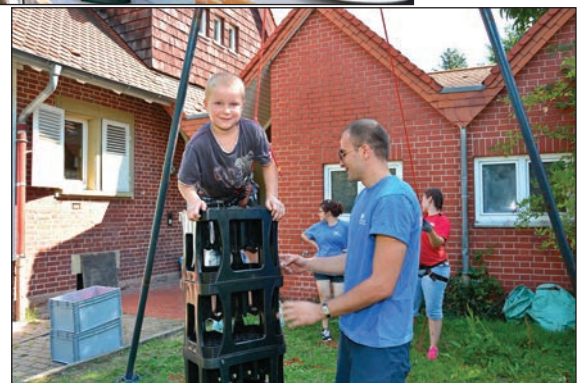
Bild 1:Essensausgabe, Bild 2: auf dem Weg nach oben.