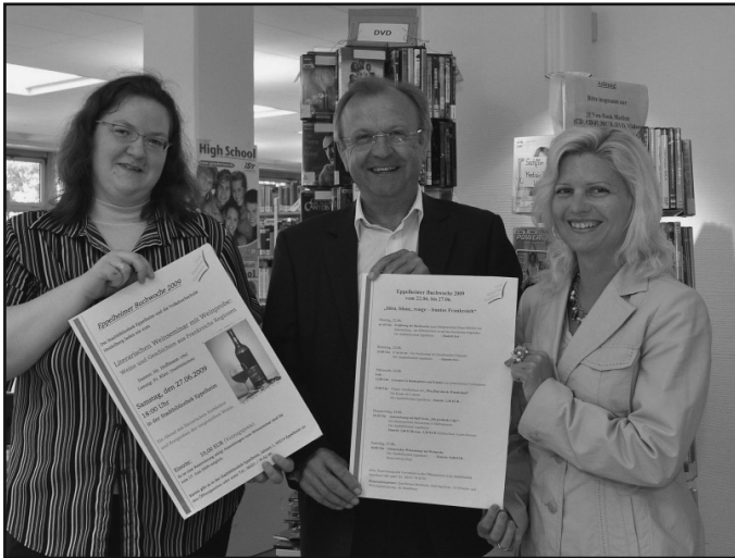
Pressegespräch anlässlich der Eppelheimer Buchwoche

Die Stadtbibliothek bleibt am Freitag, 26. Juni wegen Betriebsaufsflug geschlossen . An den anderen Tagen dieser Woche sind Sie herzlich dazu eingeladen, die verschiedenen Veranstaltungen der Eppelheimer Buchwoche zu besuchen. Die Stadtbibliothek hat an diesen Tagen wie folgt regulär geöffnet: Mo 13-18 Uhr, Mi 10-18 Uhr, Sa 10-13 Uhr