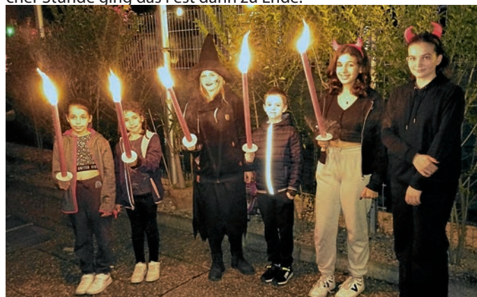
Fackelwanderung der Schützenjugend

Zwischen den einzelnen Durchgängen durften sich die kleinen und großen Hexen, Vampire und Zombies am Halloween-Buffer stärken. Zum Abschluss gab es eine Fackelwanderung im nahegelegenen Feld, bei der alle sichtlich viel Spaß hatten. Zu nächstlicher Stunde ging das Fest dann zu Ende.