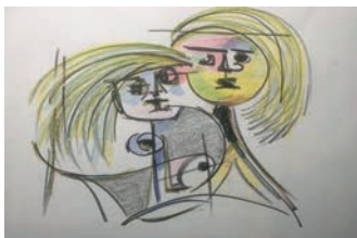
Bilder und Zeichnungen von Volker Neutard