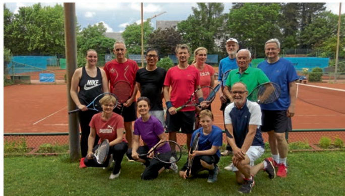
Die Teilnehmer des Blümchenturniers 2019