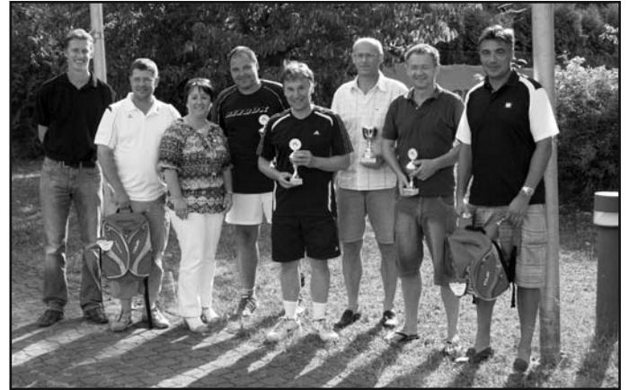
Sieger und Platzierte gemeinsam mit der Turnierleitung