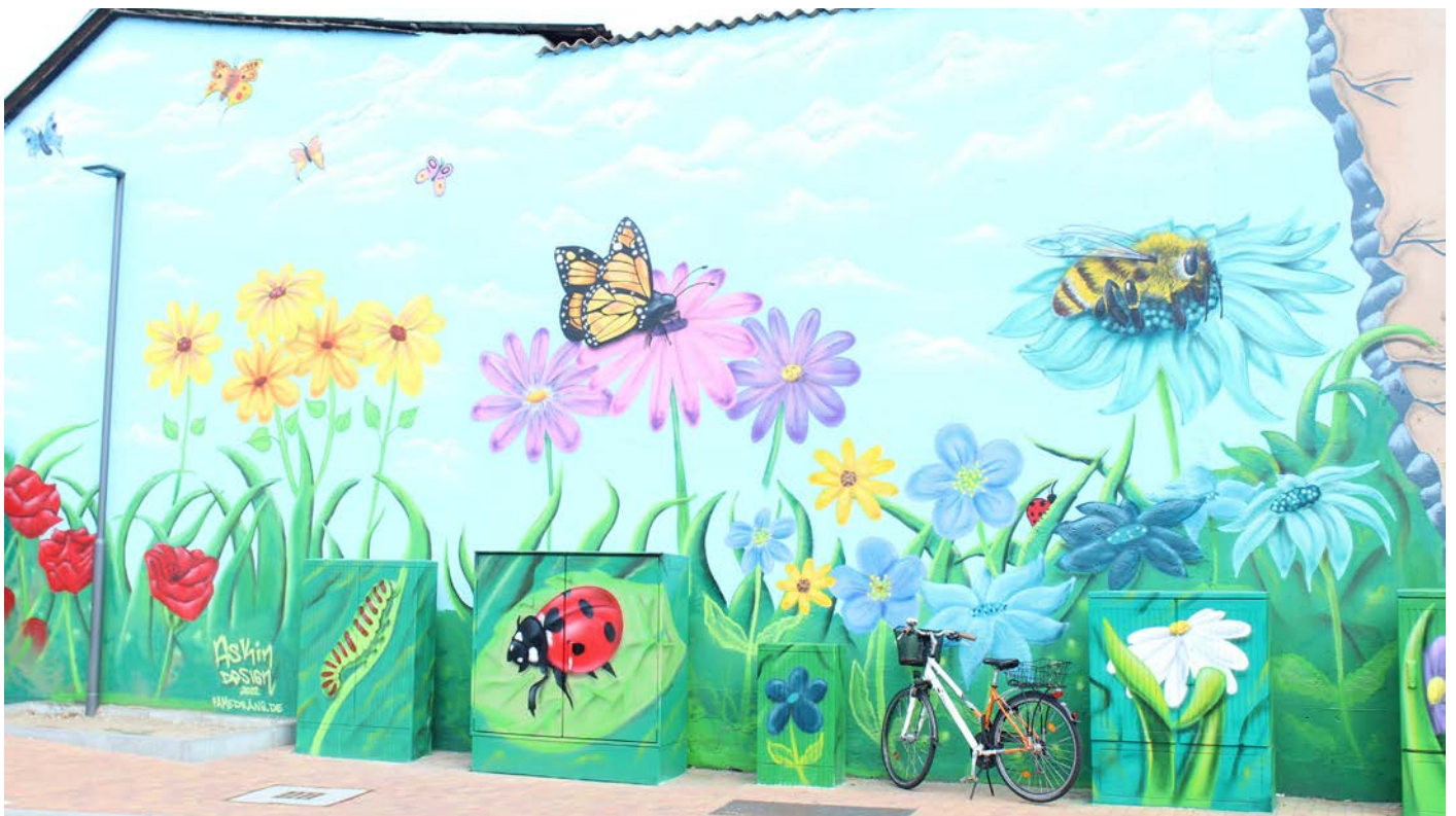
Die bunte Hausfassade an der ÖPNV-Haltestelle ist ein toller Blickfang für die Fahrgäste und Passanten.