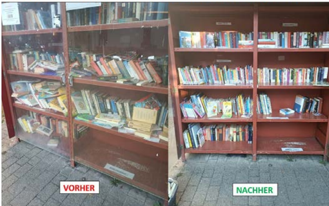
Das Eppelheimer Bücherregal am Wasserturm – bitte helfen Sie beim Ordnung halten!