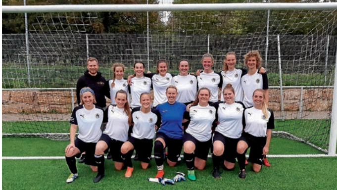
Die neuformierte Damenmannschaft: