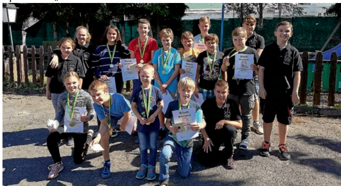
Teilnehmer des Eppelheimer Ferienprogramms mit der Eppelheimer Schützenjugend

Wir freuen uns schon heute, Sie bei der Schützenvereinigung 1912/13 Eppelheim e. V. begrüßen zu dürfen und wünschen viel Spaß und „Gut Schuss“.