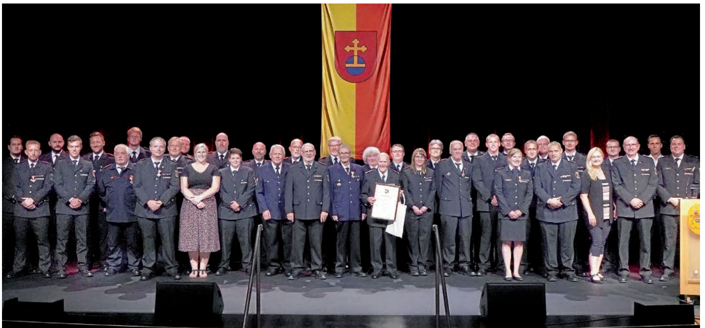
Eine große Anzahl an Ehrungen konnte die Freiwillige Feuerwehr Eppelheim dieses Mal vornehmen.