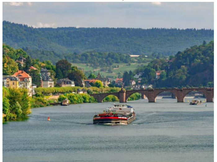
Der Seniorenausflug der Stadt Eppelheim, eine Schifffahrt auf dem Neckar, ist komplett ausgebucht.

„Das ist sehr schade“, bedauert die Bürgermeisterin, „denn ich hätte gerne alle Eppelheimerinnen und Eppelheimer über 65 Jahre, die Interesse an dem Ausflug haben, mitgenommen.“ Doch einen Trost hat sie für diejenigen bereit, die dieses Mal nicht zum Zuge kamen: „Wir werden im kommenden Jahr wieder einen Ausflug anbieten. Dann haben die Seniorinnen und Senioren Vorrang, die dieses Mal nicht berücksichtigt werden konnten. Ich freue mich schon darauf, mit Ihnen allen ins Gespräch zu kommen.“