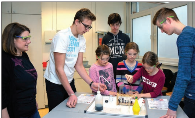
Text: C. Fesler