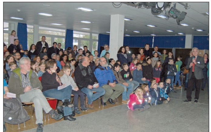
Text und Foto: Uta Fink

Die neuen Fünftklässler für das Schuljahr 2016/2017 können am Mittwoch, 16. März, und Donnerstag, 17. März 2016, von 8.00 bis 17.00 Uhr im Sekretariat angemeldet werden. Termine für die Anmeldung können im Sekretariat unter Tel. 06221/765500 vereinbart werden.