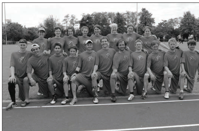
TVE Leichtathletik www.tve-leichtathletik.de