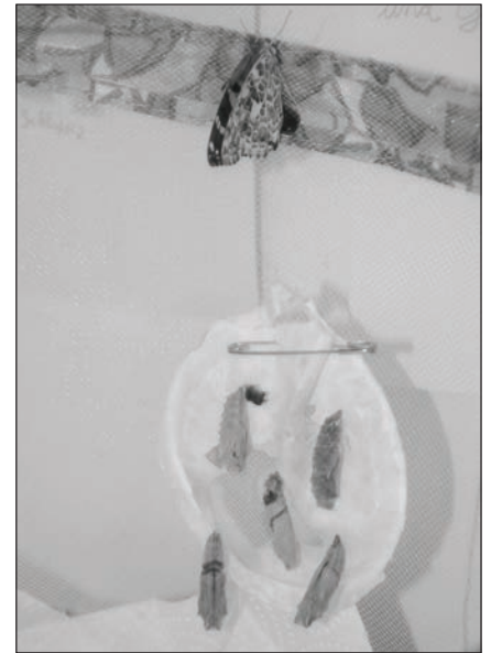
Bild: Spannende und lehrreiche Beobachtungen verdanken die Zweitklässler der Theodor-Heuss-Grundschule den Distelfaltern, deren Entwicklung sie verfolgen konnten. Hier sitzt ein flugbereiter Falter oberhalb der Puppenhülle, die er vor kurzem verlassen hat.