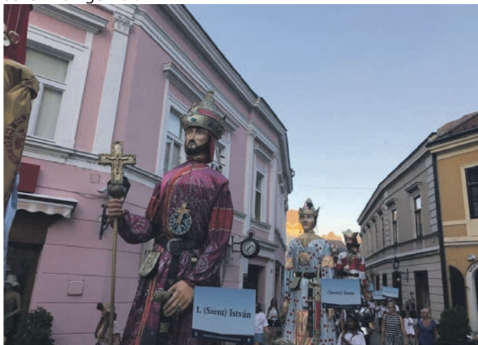
Parade der Könige durch Stuhlweisenburg, ehem. Königsstadt

Es folgte ein Besuch im Heimatmuseum und ein Ausflug in die Umgebung von Vértesacs mit einem für die Stadt wichtigen Anglersee. An diesem Wochenende fanden auch die Königstage in Stuhlweißenburg mit traditionellem Volkstanz und der Parade der Könige statt. Stuhlweißenburg liegt etwa eine halbe Stunde Fahrzeit mit dem Auto entfernt und hat die Größe einer deutschen Kreisstadt. Sie wird auch die „Stadt der Könige“ genannt, da sie im Mittelalter neben Buda die Krönungsstadt der ungarischen Könige war.