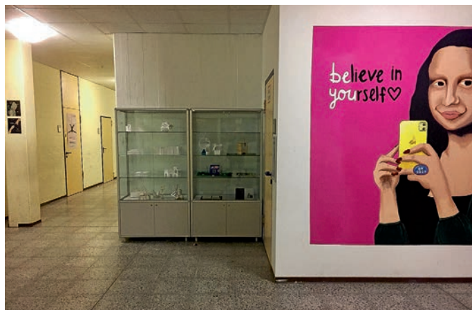
Die neue Ausstellungsvitrine.