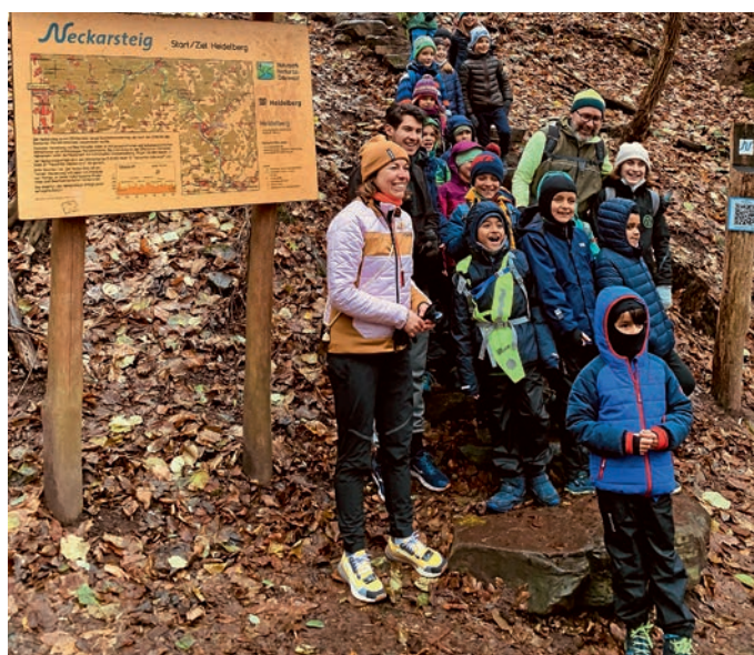
TVE-Nachwuchs und -Trainer am Fuß der Himmelsleiter.

Nachdem einige unserer Nachwuchs-Leichtathletinnen und -Leichtathleten bereits sehr erfolgreich am Heart Racer-Triathlon im September teilgenommen hatten, stand nun die nächste Herausforderung auf dem Programm: der Himmelsleiterlauf. In den Adventswochen hatte der Heart Racer e. V. dazu aufgerufen, die Himmelsleiter oberhalb des Heidelberger Schlosses zu bezwingen. Für jeden Teilnehmer und jede Teilnehmerin, der oder die unten am Fuß der Himmelsleiter eine Karte ausfüllt, die Himmelsleiter (immerhin 1600 Stufen) bezwingt und die Karten oben in einen eigens dafür eingerichteten „Briefkasten“ wirft, spenden mehrere Sponsoren jeweils 10 Euro, mit denen inklusive Projekte gefördert werden. Das ließen sich unsere U10-Leichtathleten nicht entgehen und machten sich am 10. Dezember auf, die Herausforderung auf sich zu nehmen. In einer Gruppe aus 18 Kindern und einigen Eltern stieg man um kurz nach 15 Uhr unten ein, um zwischen 20 und 45 Minuten später oben auf dem Königstuhl anzukommen – eine Schneeballschlacht gab es oben dann gratis dazu.