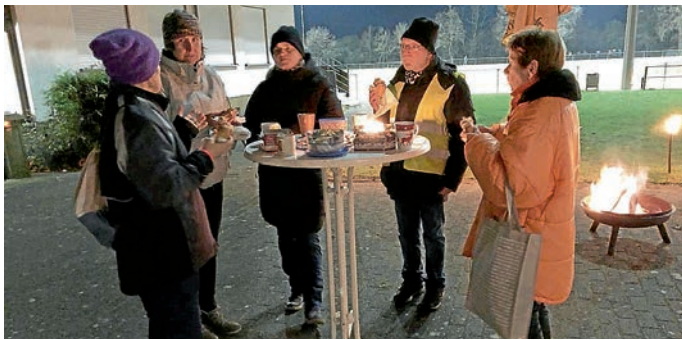
Gemütliches Beisammensein unter Corona-Bedingungen.

Wer möchte kann gerne dienstags ab 17.50 Uhr auf der Sportanlage TV Eppelheim vorbei schauen, schnuppern und mitwalken.