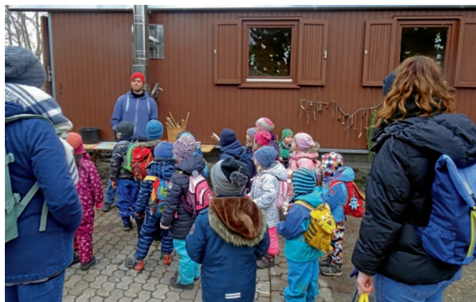
Ein toller Ausflug für die Kinder.

Auch wenn wir traurig waren, dass die zwei Tage so schnell vorbei gegangen sind, hatten wir einen Grund, uns zu freuen. Denn im März dürfen wir eine ganze Woche auf das Außengelände.