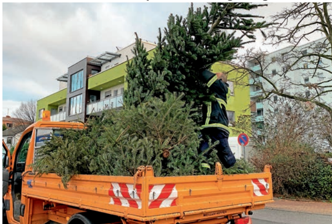
Die Weihnachtsbaum-Sammelaktion konnte stattfinden - aber mit einem verändertem Konzept.

Gerne hätte Jugendwart Matthias Pohl die Weihnachtsbaum-Sammelaktion gemeinsam mit der Jugendfeuerwehr, den Jugendleitern und tatkräftiger Unterstützung aus der Einsatzabteilung durchgeführt. Doch auch dieses Jahr machte die Corona-Pandemie erneut einen Strich durch die Rechnung. Immerhin musste die Sammelaktion nicht wie im vergangenen Jahr komplett entfallen, sondern konnte mit einem abgewandelten Konzept durchgeführt werden: Über ganz Eppelheim verteilt wurden 49 Sammelplätze eingerichtet, an denen die ausgedienten Weihnachtsbäume abgelegt werden konnten. „Das Konzept mit den zentralen Sammelplätzen wurde von den Bürgerinnen und Bürgern gut angenommen“, freute sich Matthias Pohl, „es hat alles sehr gut funktioniert!“