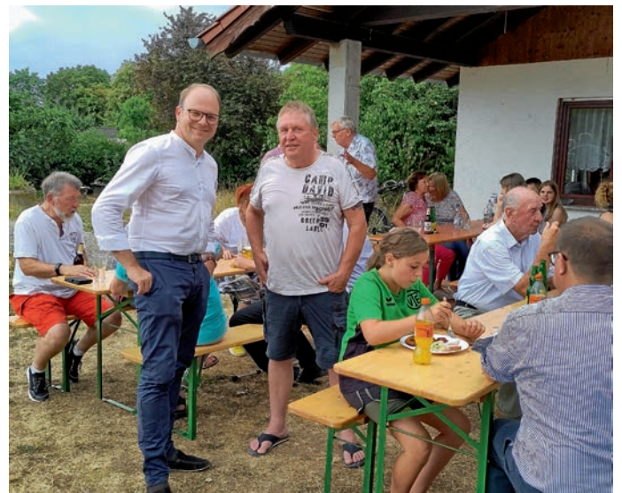
Gute Stimmung bei regem Austausch mit Alexander Föhr, MdB (2. v.l.)