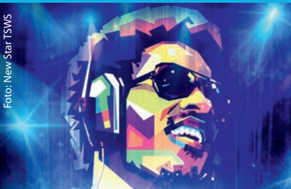
Veranstaltungen in der Rudolf-Wild-Halle ab Seite 5

Erinnerungsstücke gesucht Seite 4