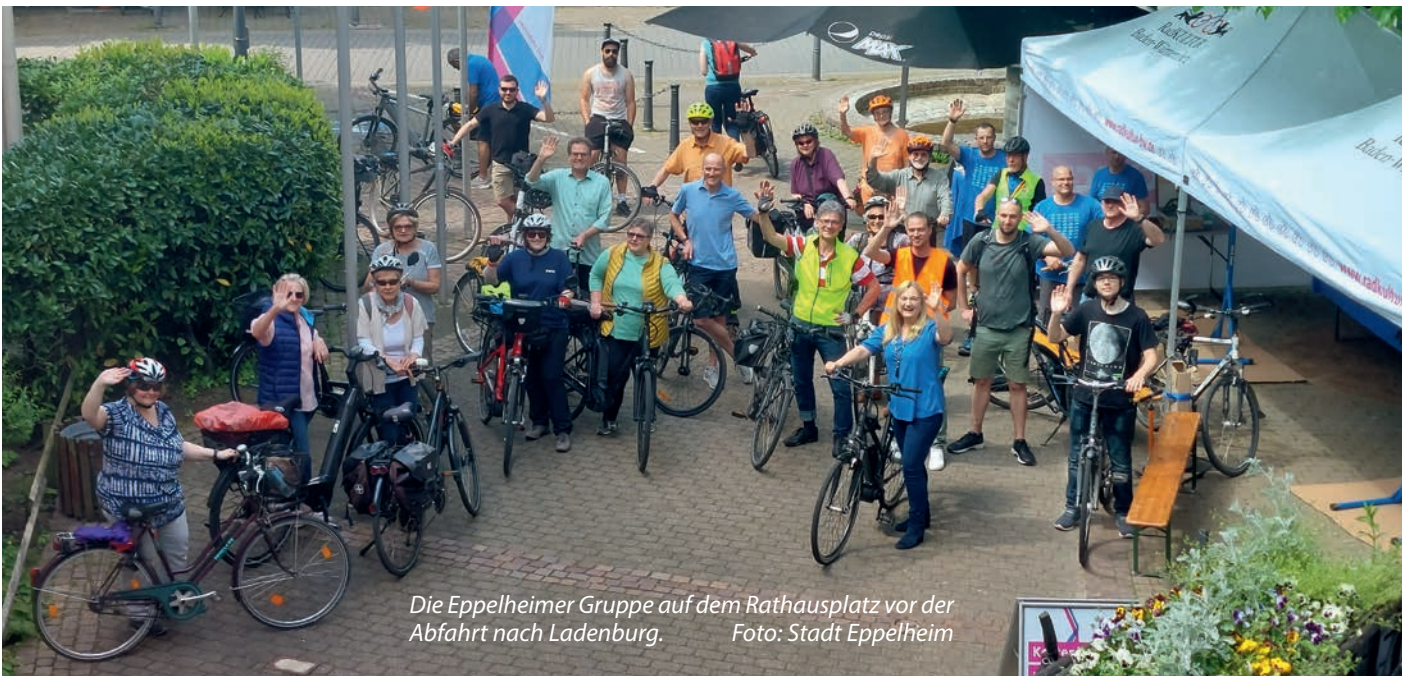
Die Eppelheimer Gruppe auf dem Rathausplatz vor der Abfahrt nach Ladenburg.