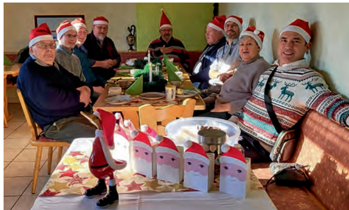
Die Teilnehmer des Senioren-Nikolausschießens 2023 mit der Siegetrophäe „die Weihnachtsente“