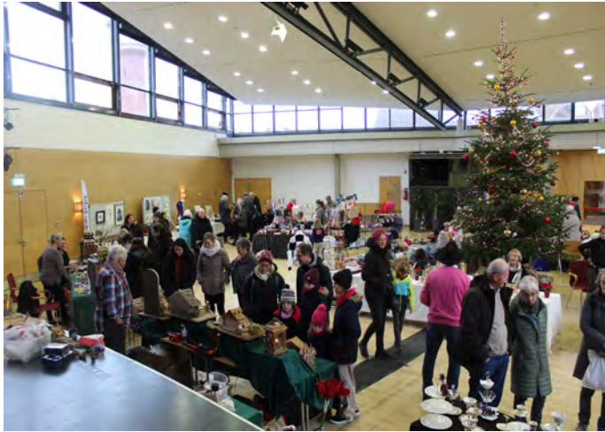
Ein Blick auf die Stände der Ausstellerinnen und Aussteller des Kunsthandwerkermarktes in der Rudolf-Wild-Halle.