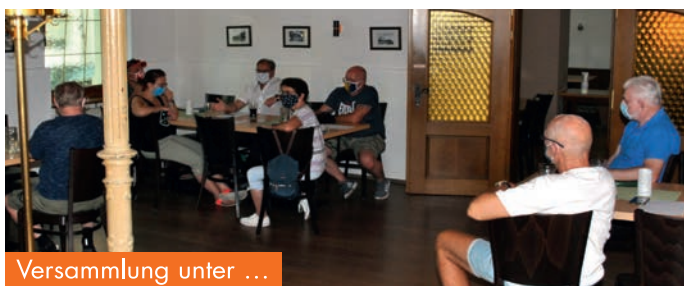
Versammlung unter ...