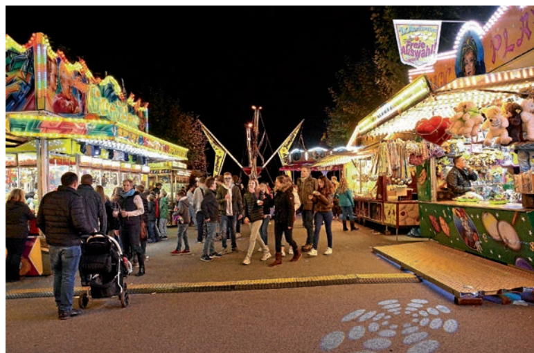
Stände der Schausteller auf dem Hugo-Giese-Platz

Nach einem Jahr mit vielen Einschränkungen, wie wir es gegenwärtig erleben, sind Begegnungen und Austausch auf Festen für unsere Stadtgesellschaft wichtig. Daher hoffe ich, dass wir uns zum Jahresende oder wenigstens im neuen Jahr wieder auf unseren traditionellen Veranstaltungen treffen können.