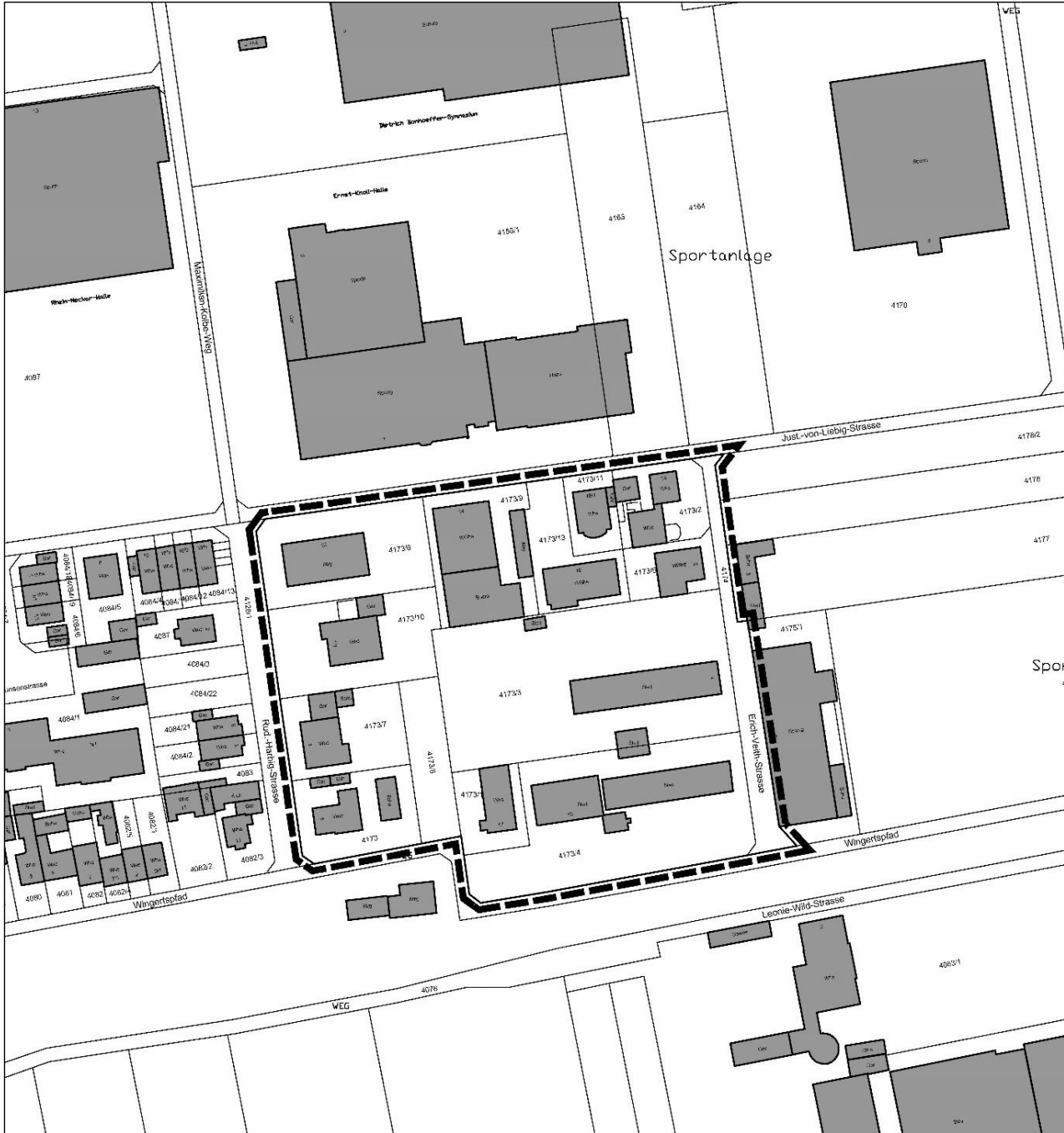
Abgrenzung des Geltungsbereichs – ohne Maßstab