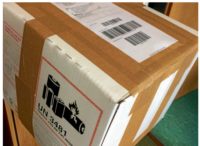
Die erste Handysammelbox auf dem Weg zum Recycling.

Im Rahmen der Nachhaltigkeitstage Baden-Württemberg stehen am Empfang des Rathauses und der Bibliothek Sammelboxen für ausgediente Handys bereit. In nur kurzer Zeit konnte die erste Sammelbox mit Altgeräten befüllt werden. Großartig! So finden wertvolle Ressourcen den Weg zurück in den Kreislauf, soziale Projekte werden unterstützt und die Umwelt wird geschont. Der Stadtverwaltung ist es wichtig dauerhaft eine Möglichkeit für die Abgabe von Althandys zu bieten, daher steht bereits die nächste Sammelbox bereit. Weitere Informationen zur Handy-Aktion finden sie auch bei uns auf der Homepage https://www.eppelheim.de/pb/Start/Rathaus/Umwelt.html oder auf der Facebook-Seite „Umwelt & Natur Eppelheim“.