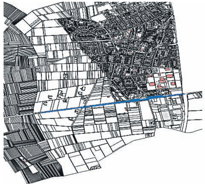
Abb. Lageplan zur Veränderungssperre „Ehemaliges Bahngelände“ (verkleinerter Auszug)