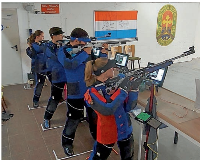
Jugendtraining bei der SVgg Eppelheim.