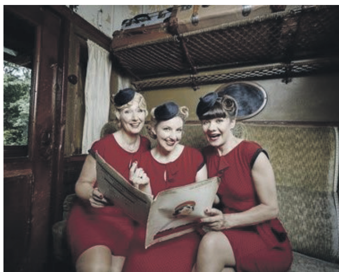
Die Zimtschnecken

Verschenken Sie Vorfreude und eine unterhaltsame Zeit mit Eintrittskarten oder Gutscheinen für die Spielzeit 2019/2020 in der Rudolf-Wild-Halle.