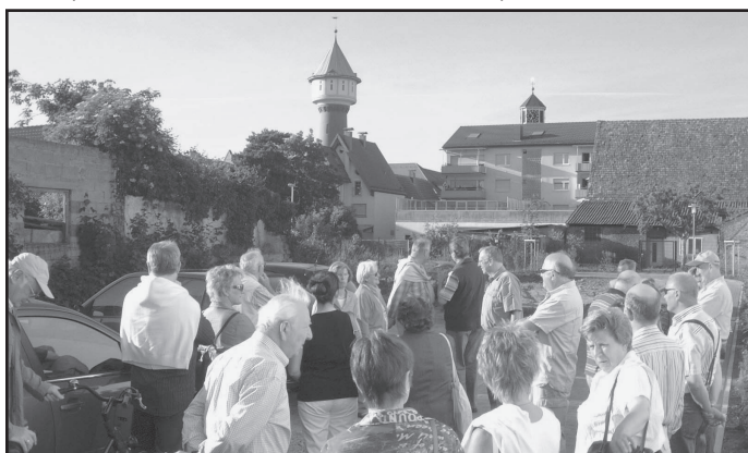
Auffälliger ist der Dr. Haselmann-Weg. Hier wurde bestehender