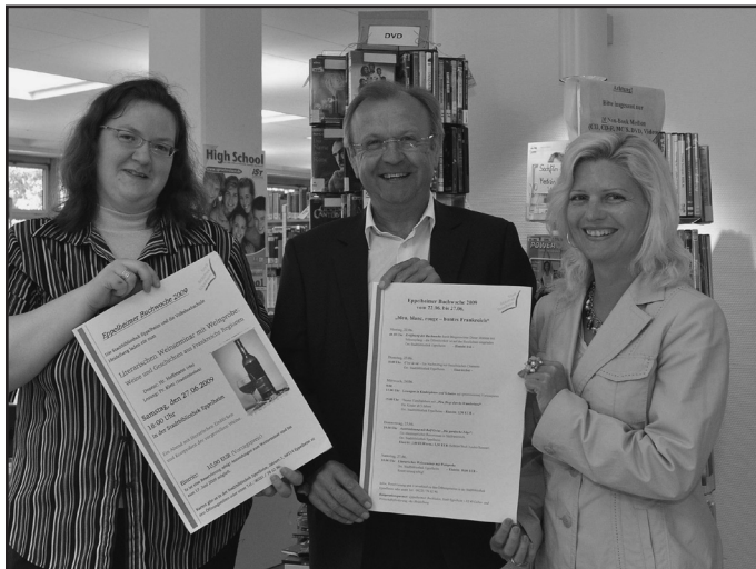
Pressegespräch anlässlich der Eppelheimer Buchwoche

Die Stadtbibliothek bleibt am Freitag, 26. Juni wegen Betriebsaufschlag geschlossen . An den anderen Tagen dieser Woche sind Sie herzlich dazu eingeladen, die verschiedenen Veranstaltungen der Eppelheimer Buchwoche zu besuchen. Die Stadtbibliothek hat an diesen Tagen wie folgt regulär geöffnet: Mo 13-18 Uhr, Mi 10-18 Uhr, Sa 10-13 Uhr