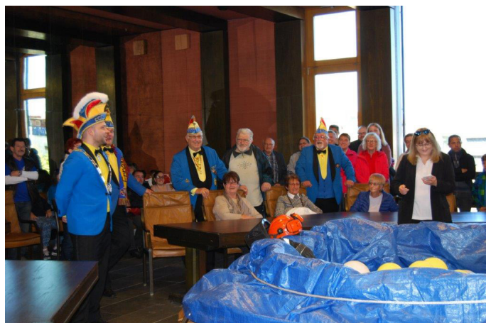
Allgemeinwissen steht auf dem Prüfstand.