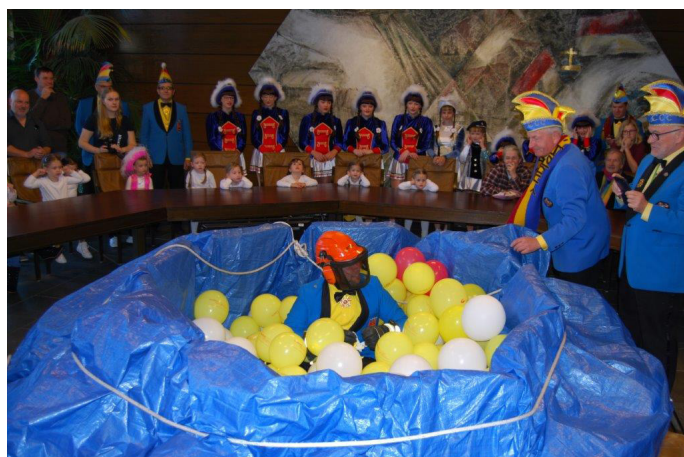
Suche nach dem Schlüssel