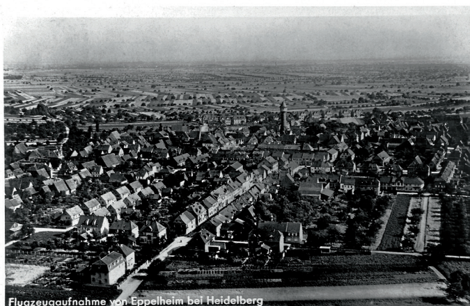
Flugzeugaufnahme von Eppelheim bei Heidelberg

Für verschiedene Zwecke anlässlich des Jubiläumsjahres 2020 sucht die Stadtverwaltung Bilder aus Eppelheim (Gebäude, Veranstaltungen, etc.) als Ergänzung zu den vorliegenden Archivbildern. Natürlich gerne auch die Geschichten hinter diesen Bildern. Vor allem aus den Jahren 1890 bis 1970. Die Bilder werden durch die Stadtverwaltung digitalisiert und der Eigentümerin/ dem Eigentümer zurückgeführt.