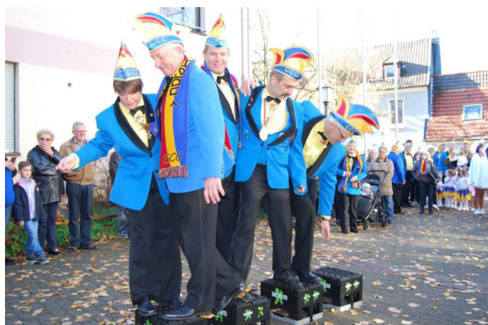
Der Elferrat bei der ersten Aufgabe