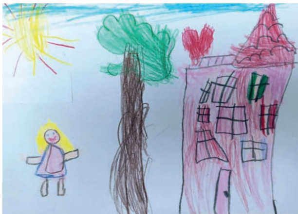
Foto: gemaltes Bild eines Kindergartenkindes