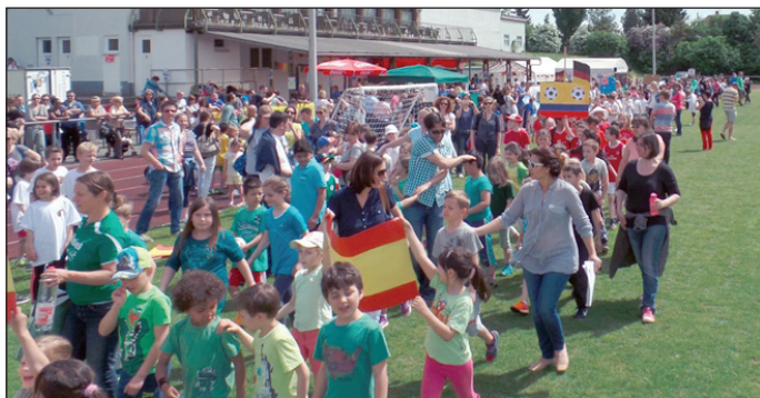
Bild: Einlauf der Nationen

Gleich nach dem Einlauf der Nationen ging es zur Sache und es entwickelten sich tolle, spannende Spiele. Alle Teams gingen mit großem Tatendrang gepaart mit viel Fairness und Spielfreude in ihre Gruppenspiele, denn alle hatten ein gemeinsames Ziel: Den Sieger-Pokal wird unser Team in den blauen Eppler Himmel strecken!