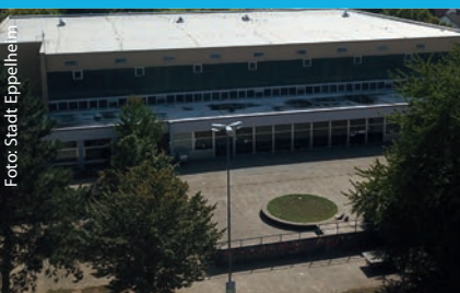
Erinnerungsstücke gesucht Seite 3

Während der Sommerferien gibt es im Rathaus, in der Stadtbibliothek und im Gisela-Mierke-Bad geänderte Öffnungszeiten.