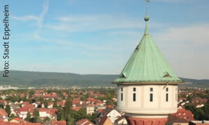
Aus dem Vereinsleben ab Seite 12

Veranstaltungen in der Rudolf-Wild-Halle ab Seite 5