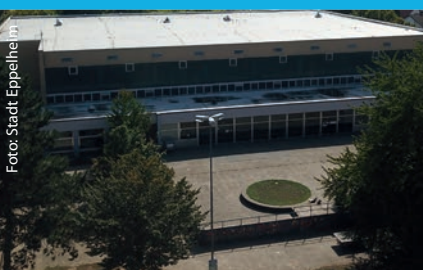
Erinnerungsstücke gesucht Seite 4

Während der Sommerferien gibt es im Rathaus, in der Stadtbibliothek und im Gisela-Mierke-Bad geänderte Öffnungszeiten.