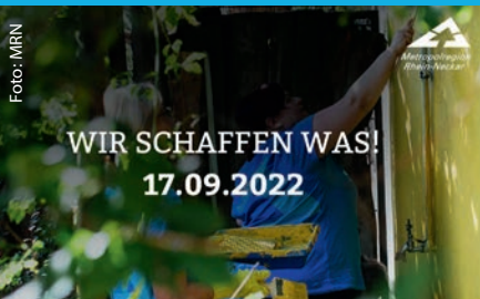
Jetzt anmelden für den Freiwilligentag Seite 3