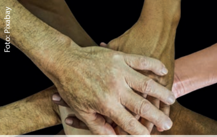
Aus dem Vereinsleben ab Seite 10

Aus der Stadtbibliothek ab Seite 5