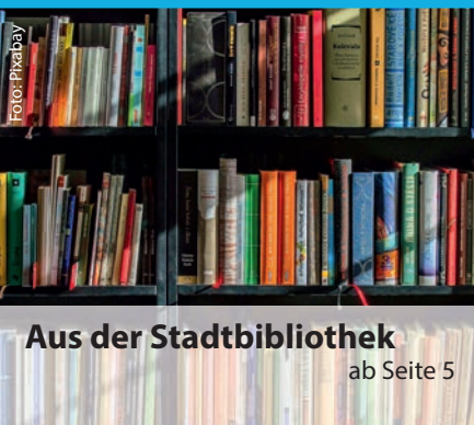
Aus der Stadtbibliothek ab Seite 5

Jetzt anmelden für den Freiwilligentag Seite 3