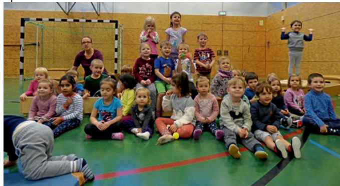
Bericht und Foto: Stephanie Reiferscheid

Der Nikolaus setzte sein Training bei den kleinsten Turnen des ASV an der Weihnachtsfeier fort. Am Weihnachtsmarkt ging es für ihn ins Fitnessstudio, diesmal gab es einen kleinen Parcours zu bewältigen. Es wurde balanciert, gehüpft, gerannt und geklettert. Im Anschluss gab es eine kleine Stärkung, diese hatten die Eltern vorbereitet. Die Trainerinnen Anke und Sina hatten vom Nikolaus ein kleines Geschenk für jedes Kind bekommen, über das sich alle sehr freuten. Die Weihnachtsfeier fand gemeinsam vom Eltern-Kind-Turnen und dem Turnen der 3-4-jährigen statt. Die Übungsstunden für das Kleinkinderturnen, 3-4 Jahre, finden jeweils am Montag von 16.00-17.00 Uhr in der Rudolf-Wild-Sporthalle statt.