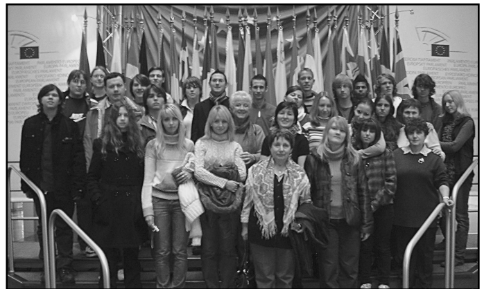
Zu Gast am Dietrich-Bonhoeffer-Gymnasium: Schüler und Lehrerinnen aus Moskau mit ihren Eppelheimer Austauschpartnern