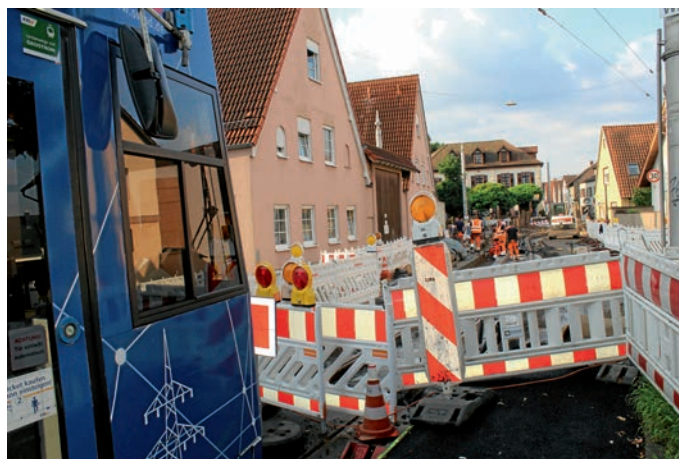
Die Hauptstraße beziehungsweise die Schwetzinger Straße bleibt zwischen Blumenstraße und Clara-Schumann-Weg bis voraussichtlich 24. September für den Verkehr gesperrt.

Ab Samstag, 25. September, werden die Schwetzinger Straße und die Hauptstraße wieder weitestgehend für den Verkehr freigegeben. Lediglich im Bereich der Ersatzhaltestelle an der „Grenzhöfer Spitze“ bleibt die Hauptstraße in Fahrtrichtung Plankstadt gesperrt. Kleinräumige Umleitungen werden vor Ort ausgeschildert.