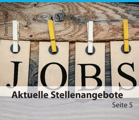
Aktuelle Stellenangebote Seite 5