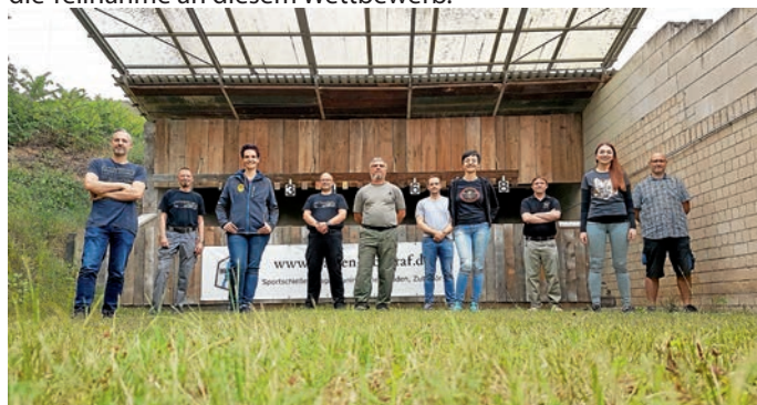
Auf dem Foto: Teilnehmer der offenen Vereinsmeisterschaft

Wir bedanken uns beim „Fallplatten-Team“ (Ferenc, Thomas und Elli) für den reibungslosen Ablauf und bei unseren Schützen für die Teilnahme an diesem Wettbewerb.