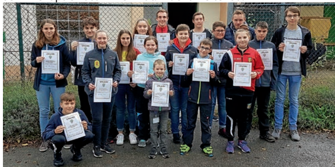
Schützenjugend der Vereine SVgg Eppelheim, SSV Oftersheim und SV Rheinau

Zuletzt gratulieren wir natürlich noch unserer Schützenjugend, die an diesem Tag nicht nur zeigen konnte, dass sich das Training lohnt, sondern auch, dass „Verein“ bei uns gelebt wird und man sehr viel Spaß zusammen hat. Macht weiter so!