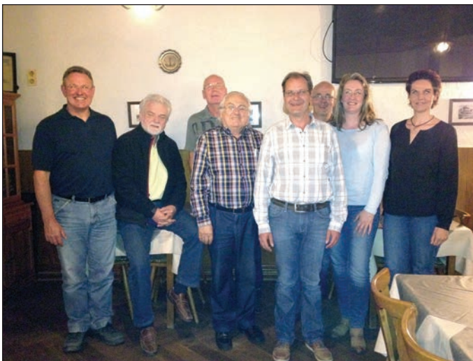
Auf dem Bild von links:

Nach abschließendem Meinungsaustausch über aktuelle Themen aus dem Gemeinderat und über das Eppelheimer Ortsgeschehen wurde die Jahreshauptversammlung beendet.