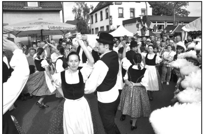
Am Samstagabend lockten zum Straßenfest in etlichen Vereinszelten Bands mit Rock- und Popmusik das Publikum an und sorgten für prima Kerwelaune.