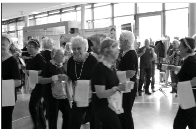
Der Tanzkreis "Spätlese" beim Eröffnungstanz "Café au lait"